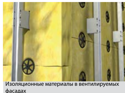
Изоляционные материалы в вентилируемых фасадах