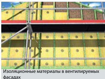
Изоляционные материалы в вентилируемых фасадах