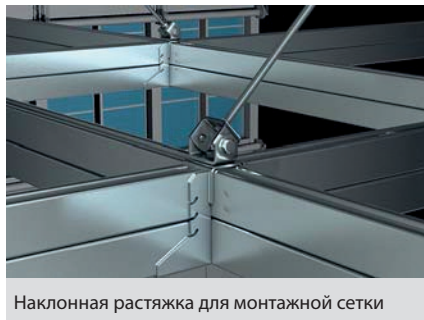
Наклонная растяжка для монтажной сетки