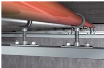
Подпятник на монтажной шине