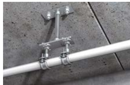
Неподвижное крепление пластиковой трубы