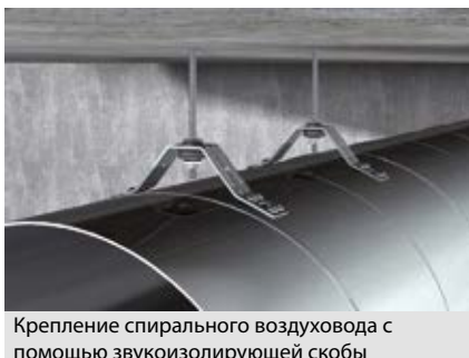
Крепление спирального воздуховода с помощью звукоизолирующей скобы