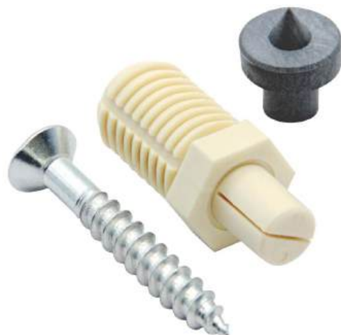
Фото и чертеж изделия