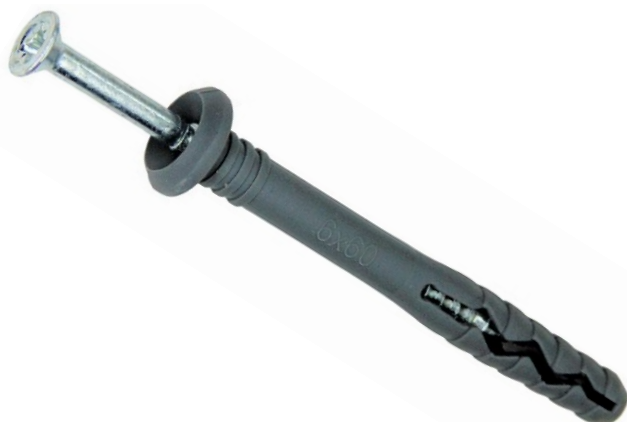
Фото и чертеж изделия