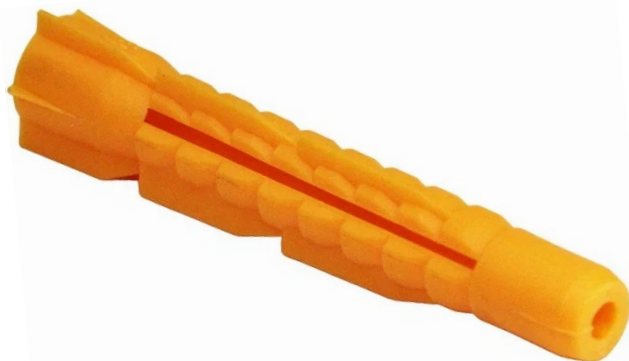
Фото и чертеж изделия