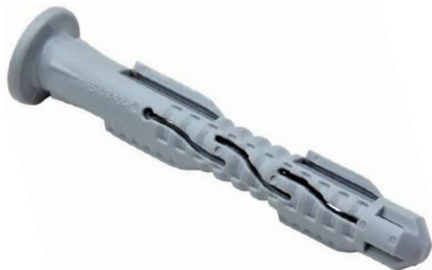
Фото и чертеж изделия