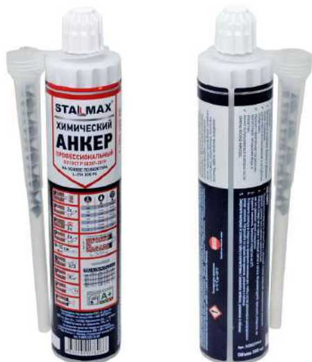
Фото изделия и таблица по отверждению