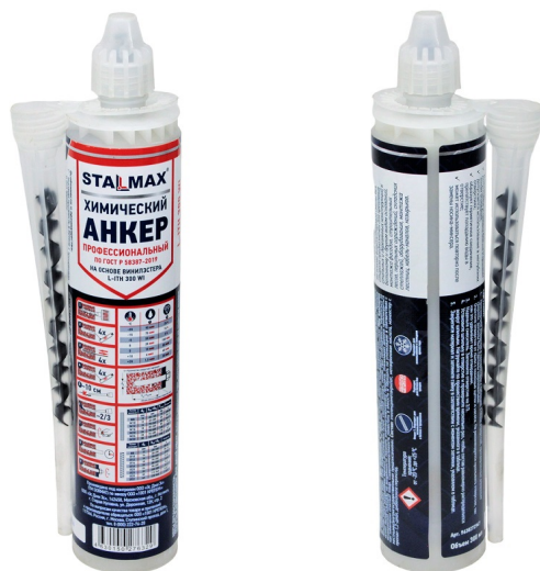
Фото изделия и таблица по отверждению