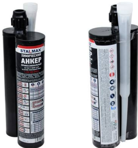
Фото изделия и таблица по отверждению