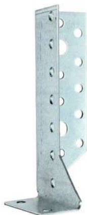
Фото и чертеж изделия