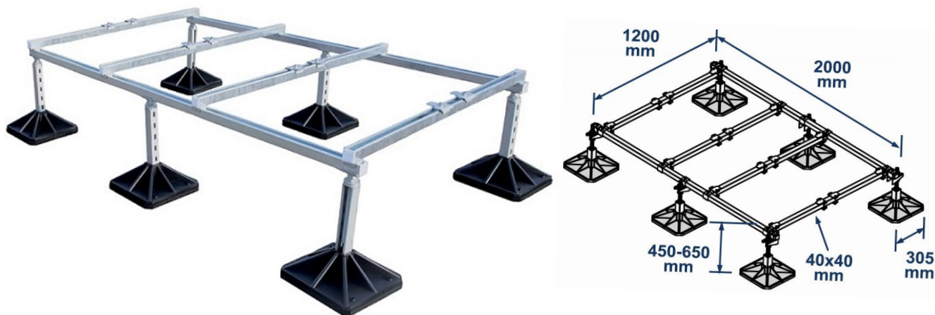
Фото и чертеж изделия