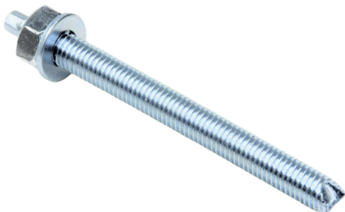
Фото и чертеж изделия