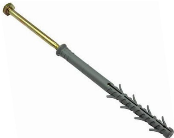
Фото и чертеж изделия