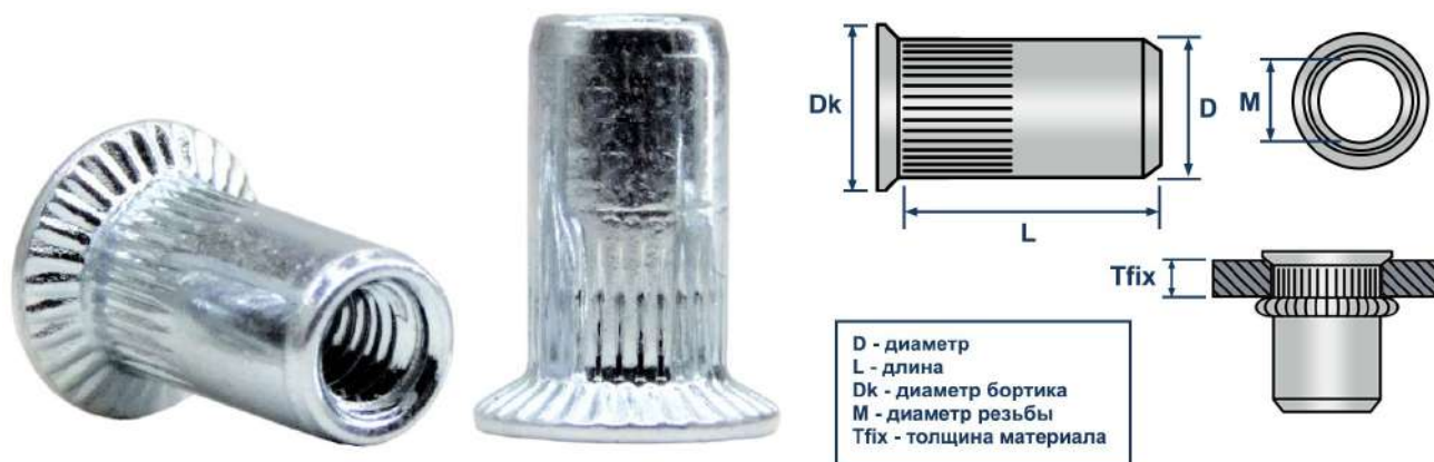
Фото и чертеж изделия