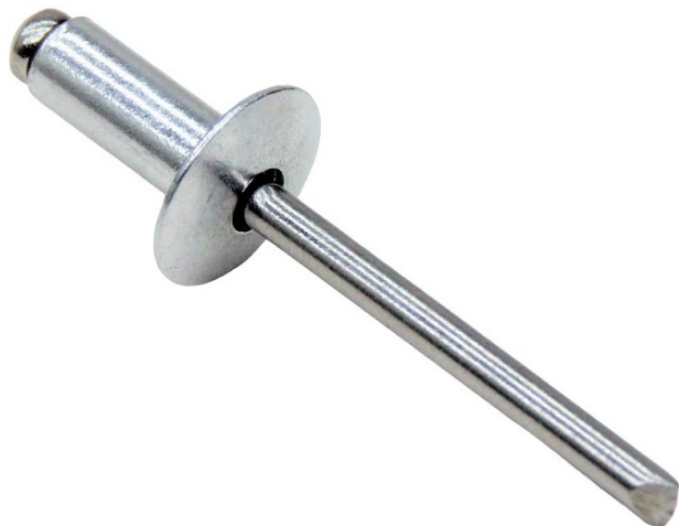
Фото и чертеж изделия