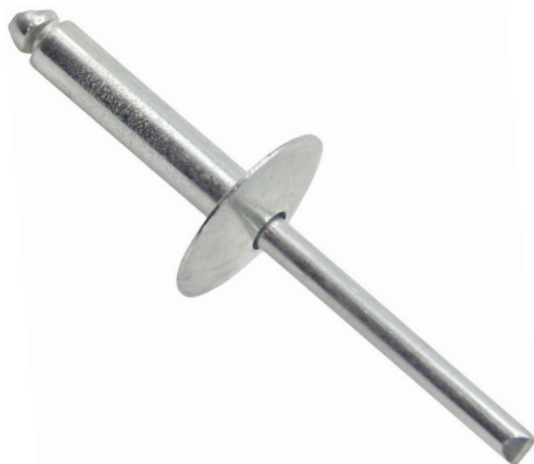
Фото и чертеж изделия