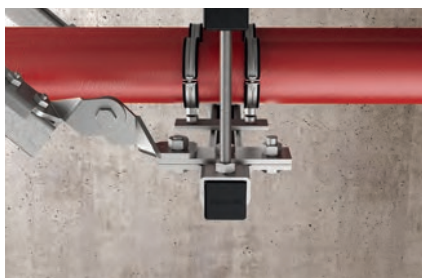
Усиление конструкции из монтажных шин