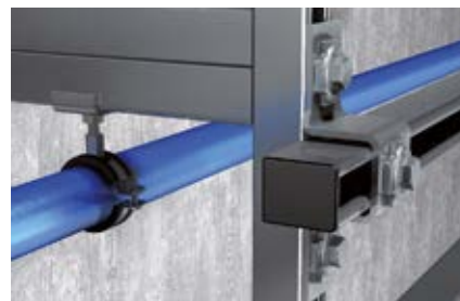
Поперечное соединение монтажных шин