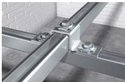
Поперечное соединение монтажных шин