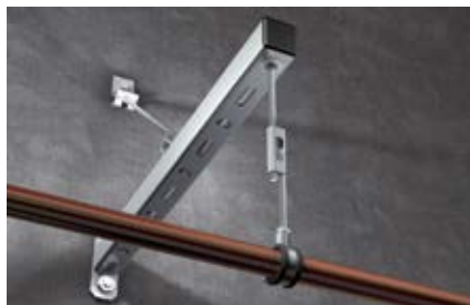
Крепление к консоли