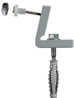
WWB 5N – Крепеж для унитазов