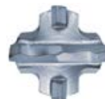
Наконечник бура SDS Max IV от ø 16 мм