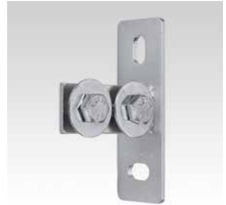
MPC-Торцовый фланец, продольное исполнение